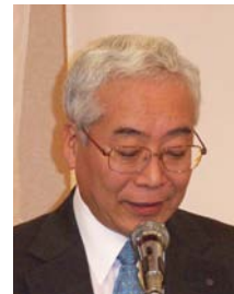
海内20周年記念事業実行副委員長