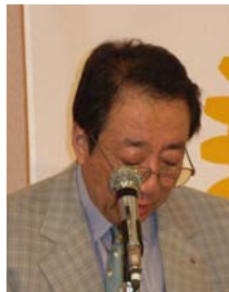
吉沼前社会奉仕委員長