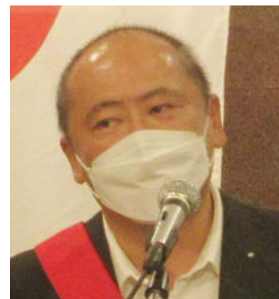
SAA (会場監督) 委員会 片岡委員長